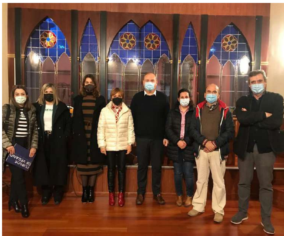
La comisión evaluadora de los cursos de verano de la UAL en su visita a Cuevas.

Cuevas del Almanzora será este verano sede de dos de los Cursos de Verano que organiza la Universidad de Almería (UAL) en la provincia almeriense.