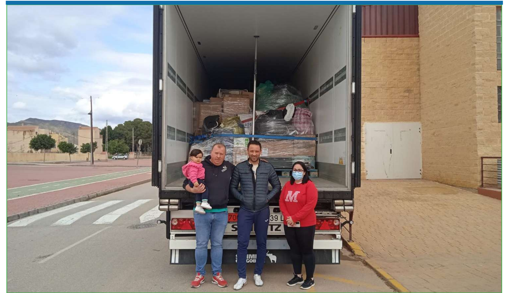
Con un punto de recogida en la Nave Polivalente y varios puntos en los comercios locales, colegios y asociaciones, se recogieron decenas de palets de material de ayuda.

Tenemos esperanza, fuerza y ganas por seguir trabajando para hacer de Cuevas un pueblo mejor y para que tod@s ganemos en calidad de vida.